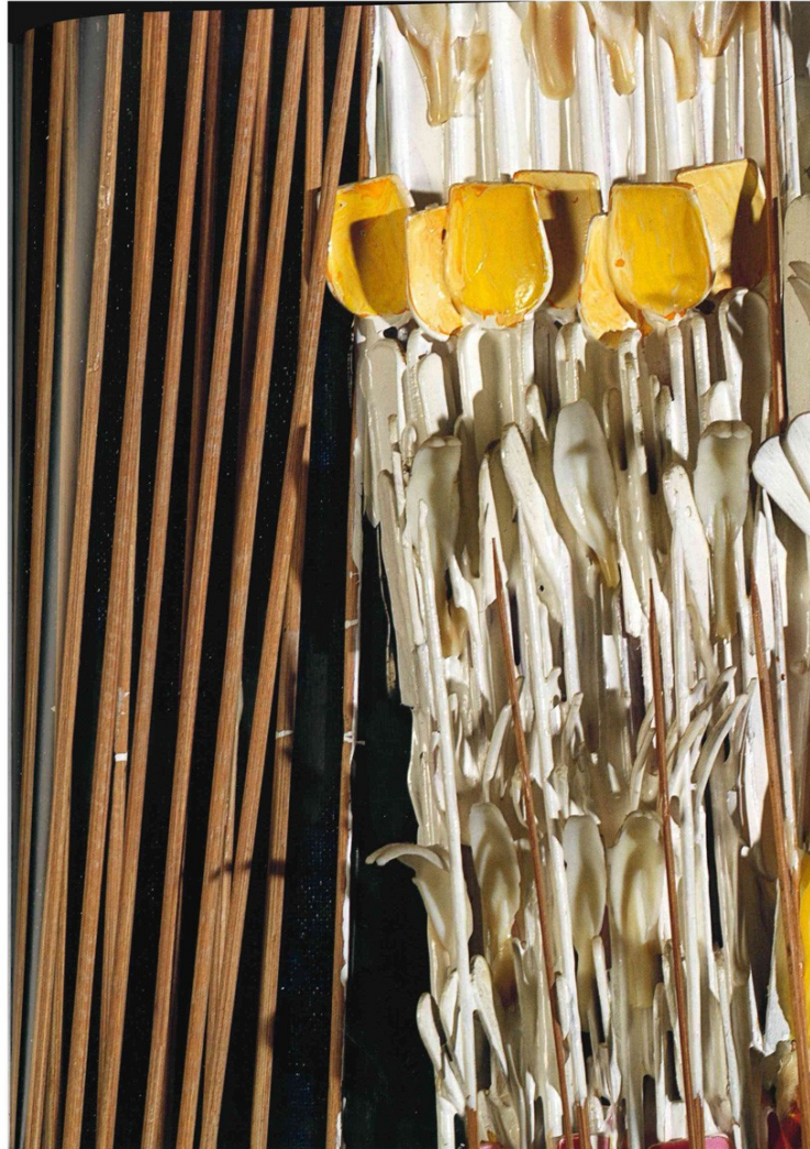
9 Maria Lai, Telaio del mattino , 1968-71, legno, spago, tempera, 162 x 63 x 25 cm. Collezione Fondazione di Sardegna, Cagliari-Sassari.