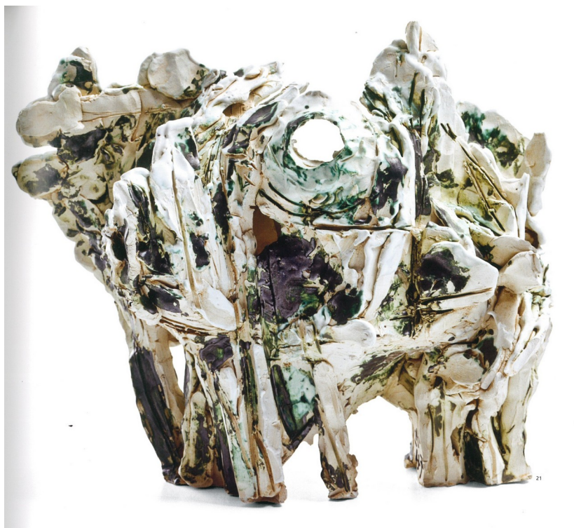
3 Maria Lai, Paesaggio (Bosco) , 1947, terraglia smaltata, h 29 cm. Fondazione Stazione dell'arte, Ulassai.