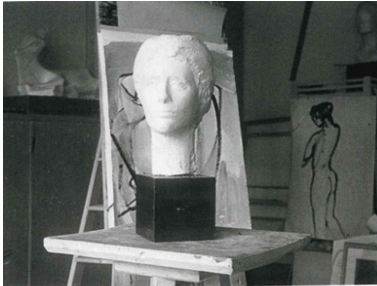
4 Lo studio di Maria Lai a Cagliari, anni cinquanta, fotografia b/n.