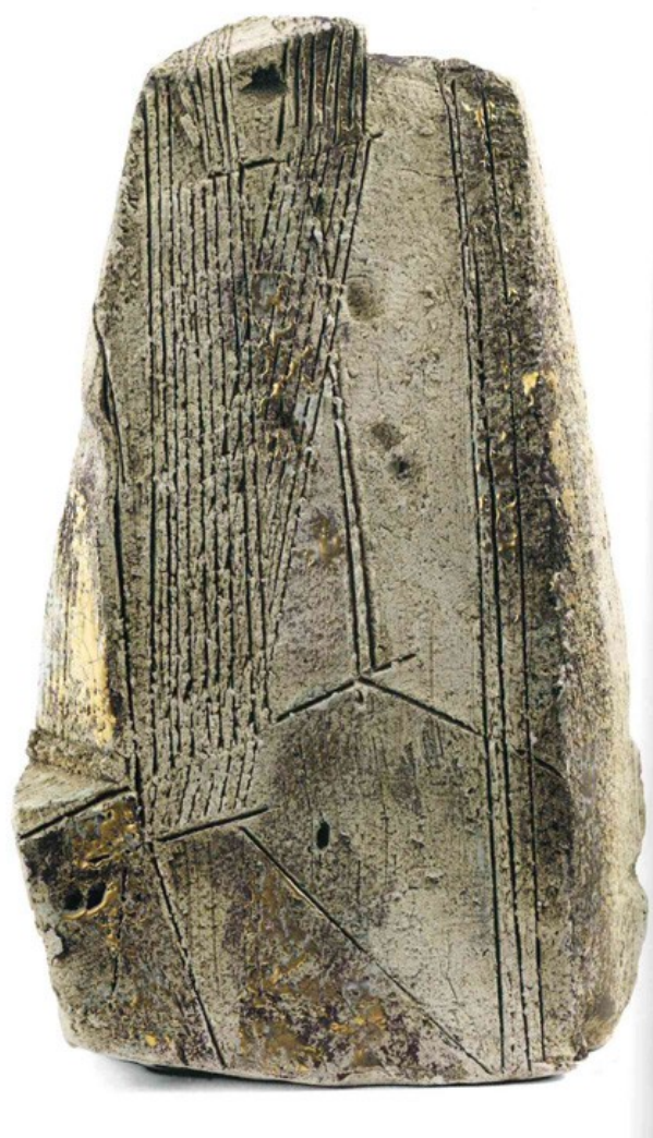
13 Maria Lai, Telaio di Maria Pietra , 1994, terracotta, 26 x 16 x 7,5 cm.