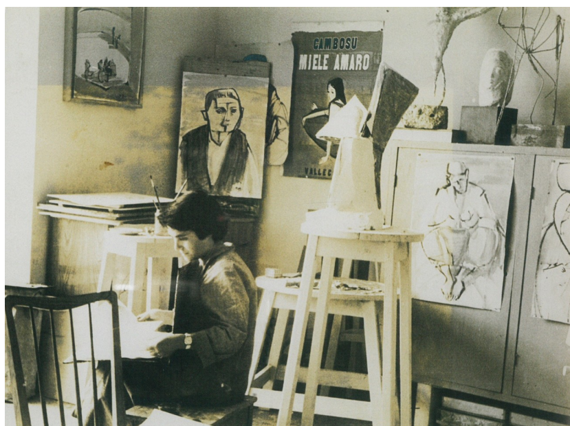
5 Maria Lai nello studio di via Rossini a Cagliari, 1954-55. Fotografia b/n.