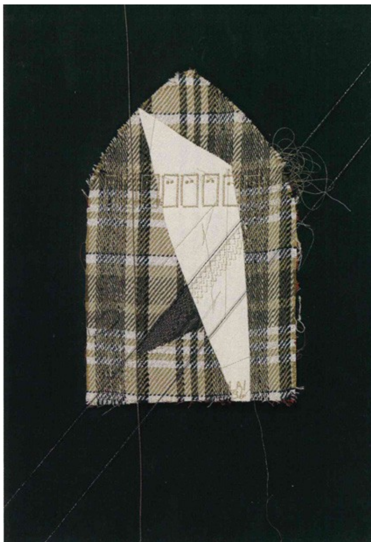
2 Maria Lai, Casa delle Janas (Le fate operose) , 1994-95, filo, stoffa, 70 x 50 cm.