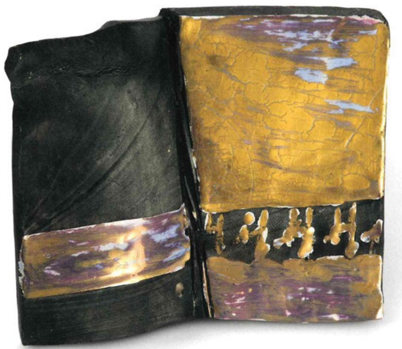
12 Maria Lai, senza titolo , s.d., caolino, smalto, tempera, 15 x 16 x 2,5 cm.