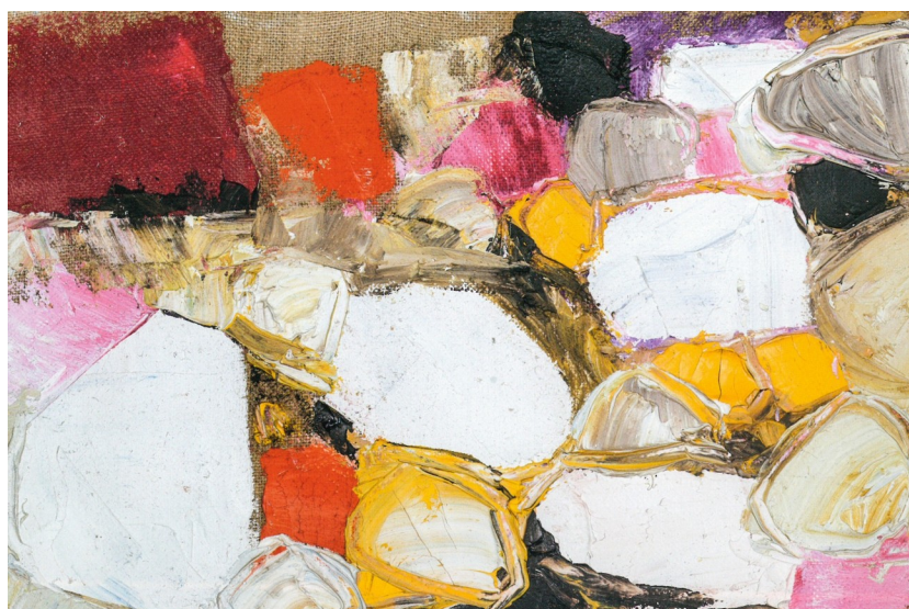
6 Maria Lai, Paesaggio , 1967, olio su tela, 20,5 x 30,3 cm.