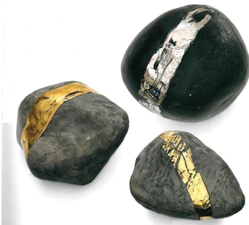
1 Maria Lai, Sassi , 1990 ca., terracotta smaltata, 19 x 10,5 cm; 21,5 x 16,5 cm; 19,5 x 11,5 cm.