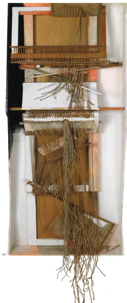
10 Maria Lai, Telaio , 1972, legno, plastica, tempera, 172 x 47 x 3 cm.