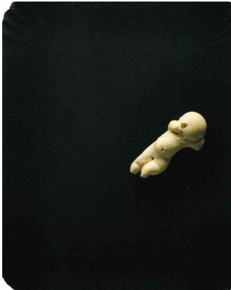
7 Maria Lai, Pupo di pane , 1977, cartone, pasta di pane, tempera, 22,3 x 19,5 x 5 cm.