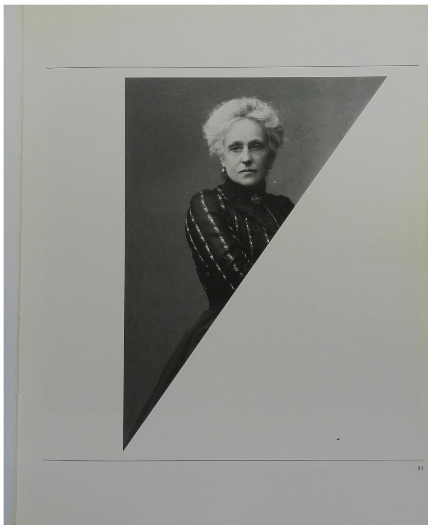
4 Fratelli Alinari, senza titolo (dalla sezione IL SÉ: non desiderano essere guardate, vogliono essere viste ), s. d., fotografia b/n, (dettaglio), da Oltre La posa , 83.