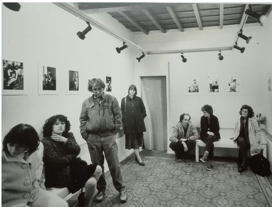
6 Fotografo non identificato, mostra personale di Silvia Marilli alla rassegna Intervallo , Fotostudio, 1985. Veduta dell'allestimento. Stampa in b/n alla gelatina bromuro d'argento, 16,2 x 21,4 cm. Donazione di Ferruccio Malandrini, collezione dell'autrice.