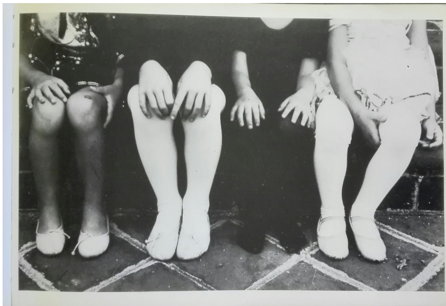
2 Francis Lansing-Toraldo, senza titolo, s. d., fotografia b/n, da Erotica , p.n.n.