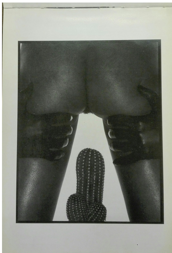
1 Verita Monselles, senza titolo , s.d., fotografia b/n, da Erotica. 21 fotografie presentano l'immaginario erotico (Firenze: Palagio di Parte Guelfa, 1984), cat. (Firenze: Grafica Style, 1984), p.n.n.