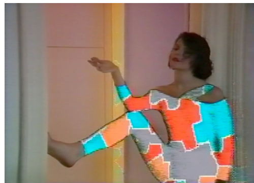
10 Metamorphosi, videoclip per il brano "Aristocratica" dei Matia Bazar, 1984, 2'44", colore, sonoro, video. Regia Metamorphosi. Coreografia Antonio Syxty. Scenografia Studio Alchimia.