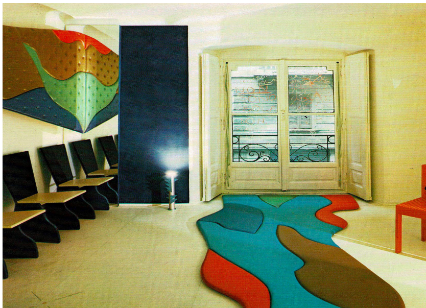
9 Studio Alchimia, La casa di Ambrogio , 1983, interni, Milano.