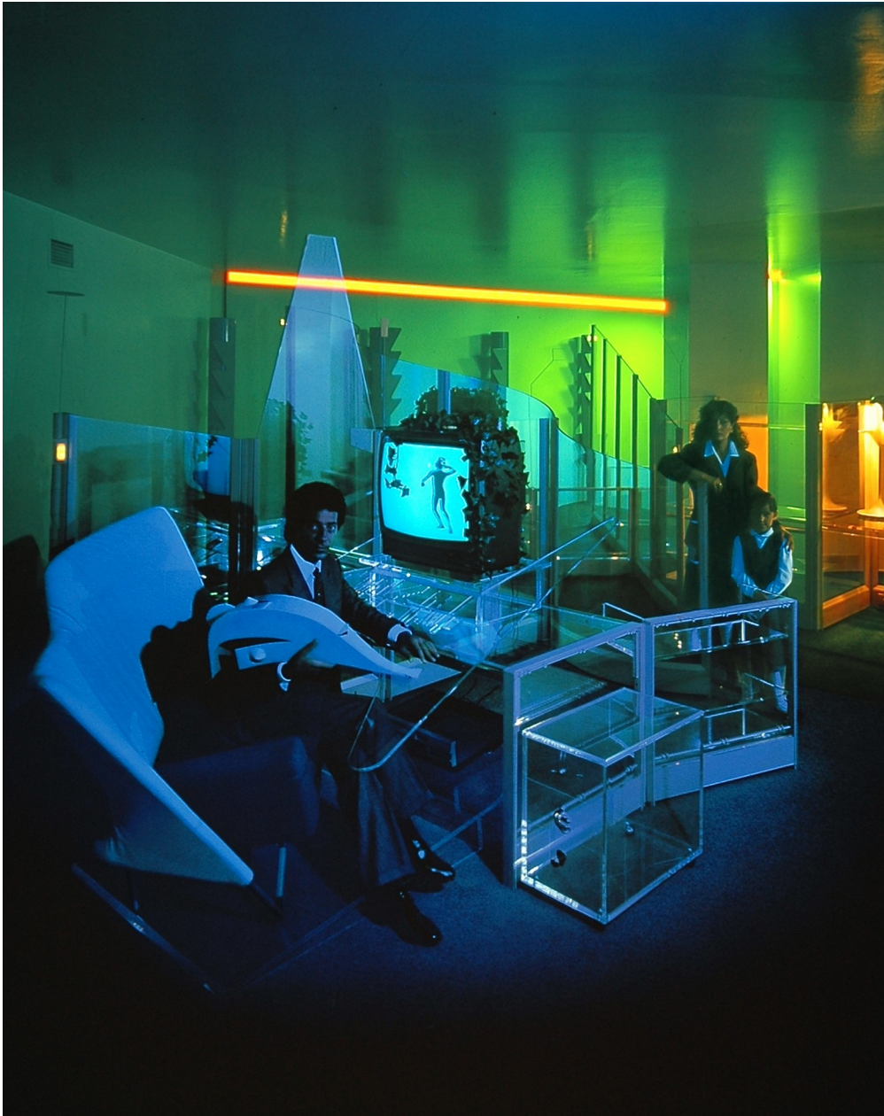
4 Occhiomagico, Interno Familiare , 1981, foto tratta dalla serie NeoModern Rooms (1981-82) utilizzata per la copertina di Domus , n. 633, novembre 1982.