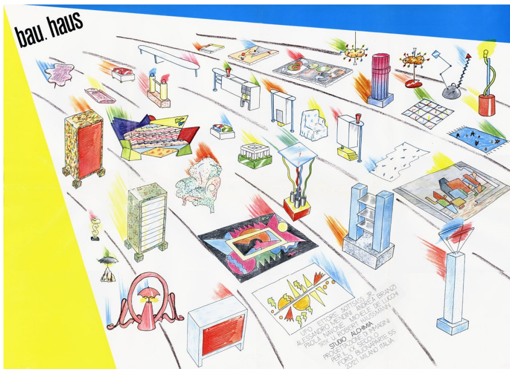
2 Studio Alchimia, bau. Haus 1 , 1979, illustrazione per manifesto.