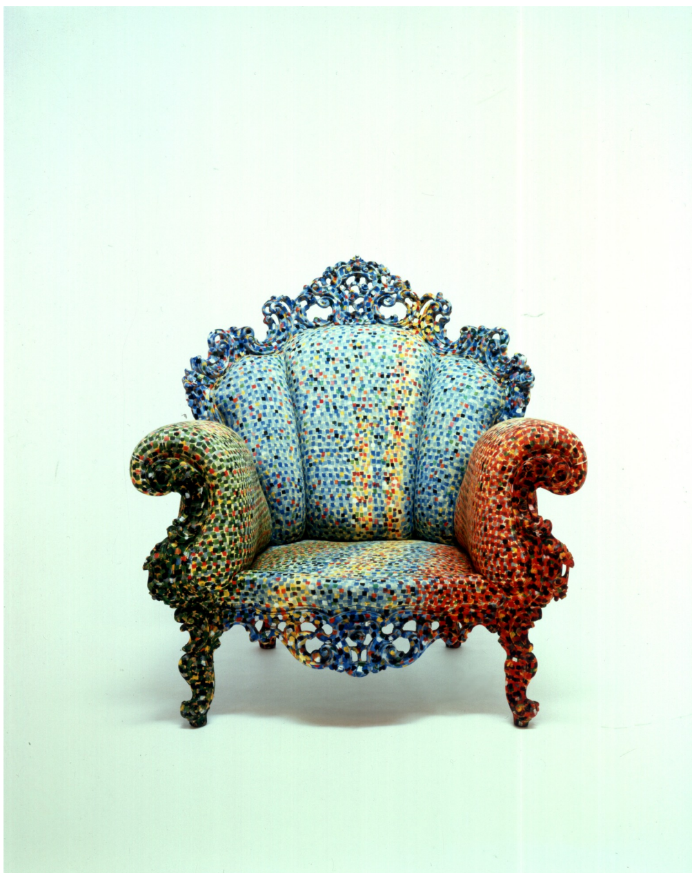
1 Alessandro Mendini, Poltrona di Proust , 1978, poltrona in legno intagliato e tessuto dipinto a mano. Courtesy © Atelier Mendini.