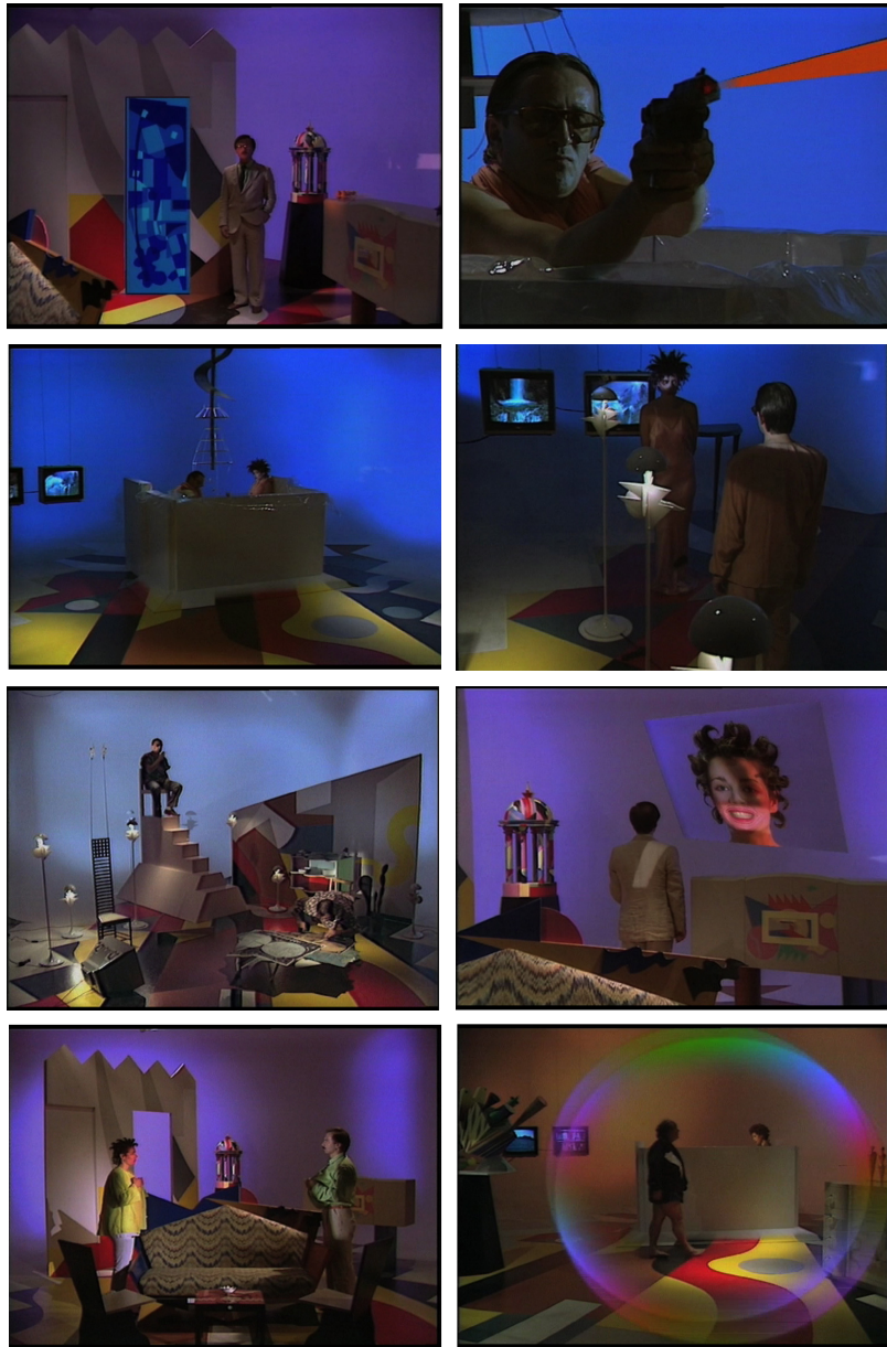
5 Metamorphosi, Aggiornato definitivo con le ultime variazioni , 1985, 63', colore, sonoro, video.