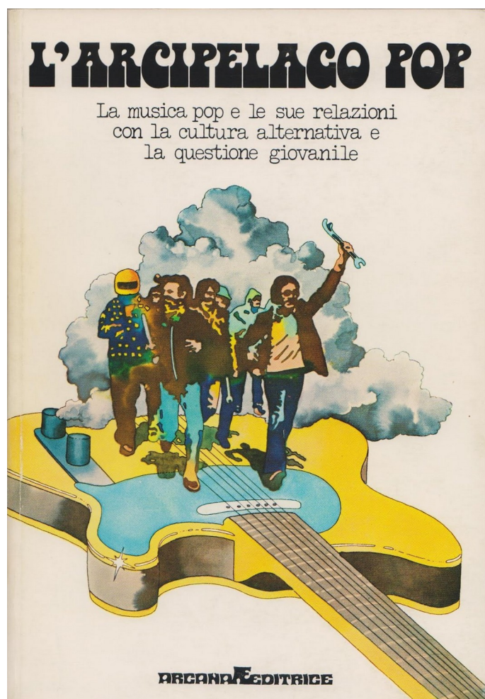
4 Copertina de L'arcipelago pop .