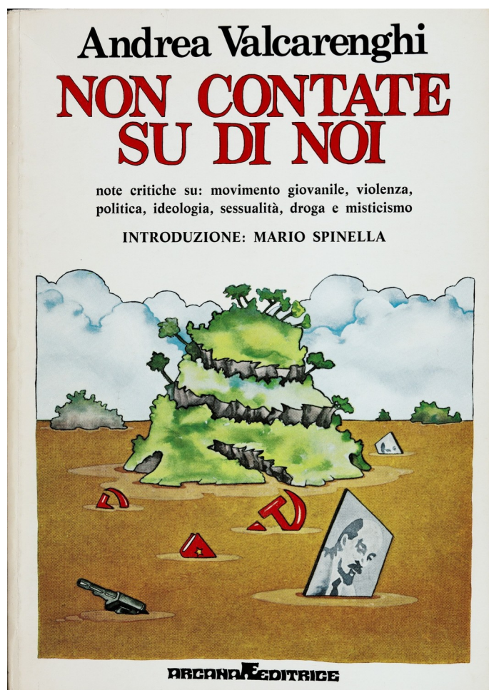
3 Copertina di Non contate su di noi di Andrea Valcarengi, grafica Studio Lapis.