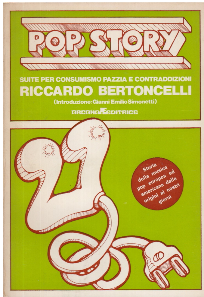
1 Copertina di Pop Story. Suite per consumismo pazzia e contraddizioni di Riccardo Bertoncelli.