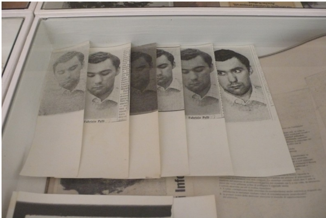
3 Laboratorio di Comunicazione Militante, materiale del workshop. Fotografia dell'allestimento dell'opera per la mostra L'immagine come controinformazione .