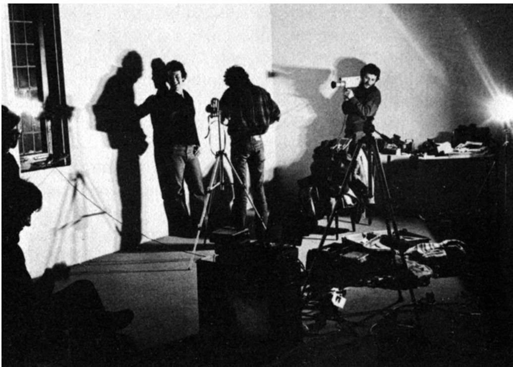
6 Laboratorio di Comunicazione Militante, Studenti che sperimentano il mezzo video in un workshop, da Laboratorio di Comunicazione Militante, L'arma dell'immagine. Esperimenti di animazione sulla comunicazione visiva (Milano: Mazzotta 1977), 36.