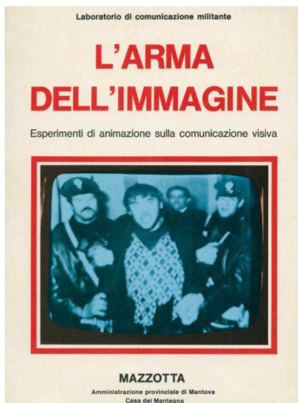
7 Copertina di: Laboratorio di Comunicazione Militante, L'arma dell'immagine. Esperimenti di animazione sulla comunicazione visiva (Milano: Mazzotta 1977).