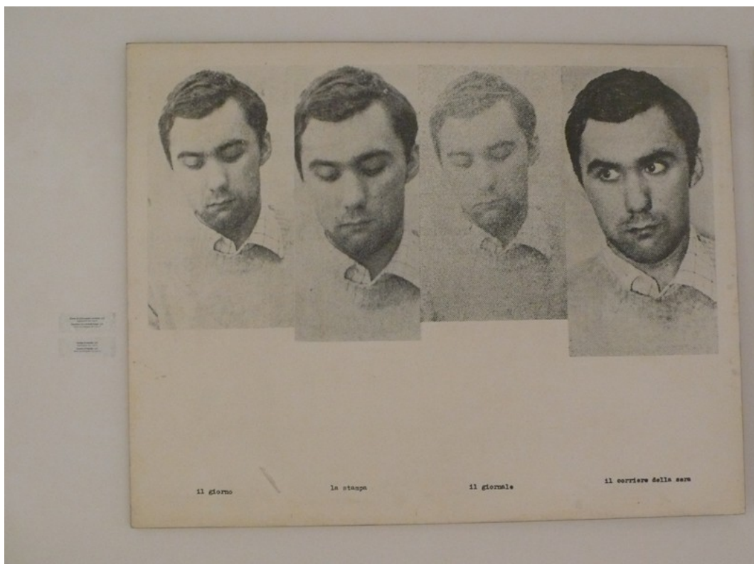
2 Laboratorio di Comunicazione Militante, Scelta e deformazione di un'immagine di criminale (Fabrizio Pelli) , gigantografia, pannello 180 x 135 cm. Fotografia dell'allestimento dell'opera per la mostra L'immagine come controinformazione .