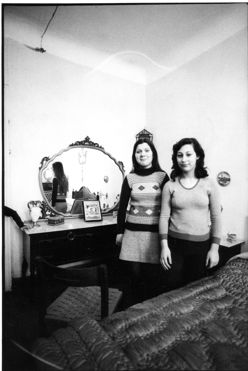
6 Paola Mattioli, senza titolo , 1975, stampa fotografica in bianco e nero, 40 x 30 cm. Archivio Paola Mattioli, Milano.