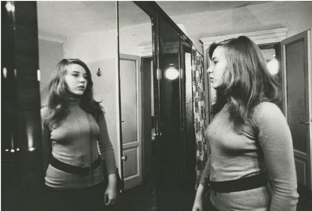
3 Giovanna Nuvoletti, senza titolo , 1975, stampa fotografica in bianco e nero, 30 x 40 cm. CSAC, Università di Parma.