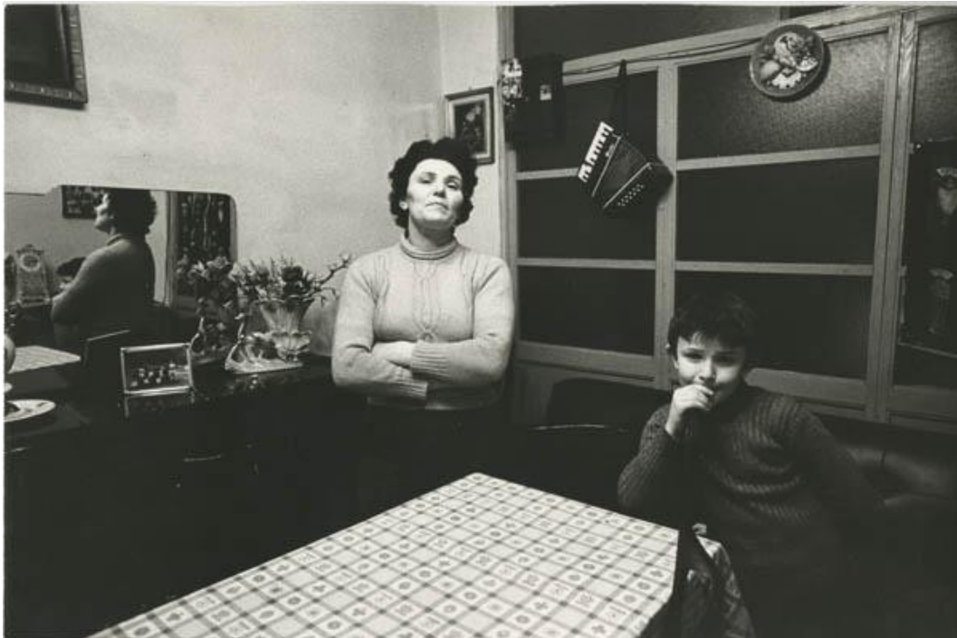
8 Giovanna Nuvoletti, senza titolo , 1975, stampa fotografica in bianco e nero, 30 x 40 cm. CSAC, Università di Parma.