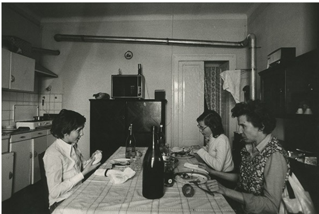
12 Carla Cerati, senza titolo , 1975, stampa fotografica in bianco e nero, 30 x 40 cm. CSAC, Università di Parma.