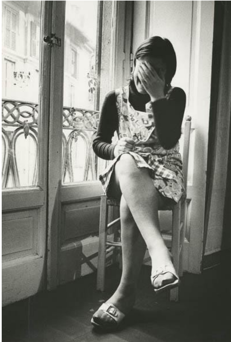
9 Giovanna Nuvoletti, senza titolo , 1975, stampa fotografica in bianco e nero, 40 x 30 cm. CSAC, Università di Parma.