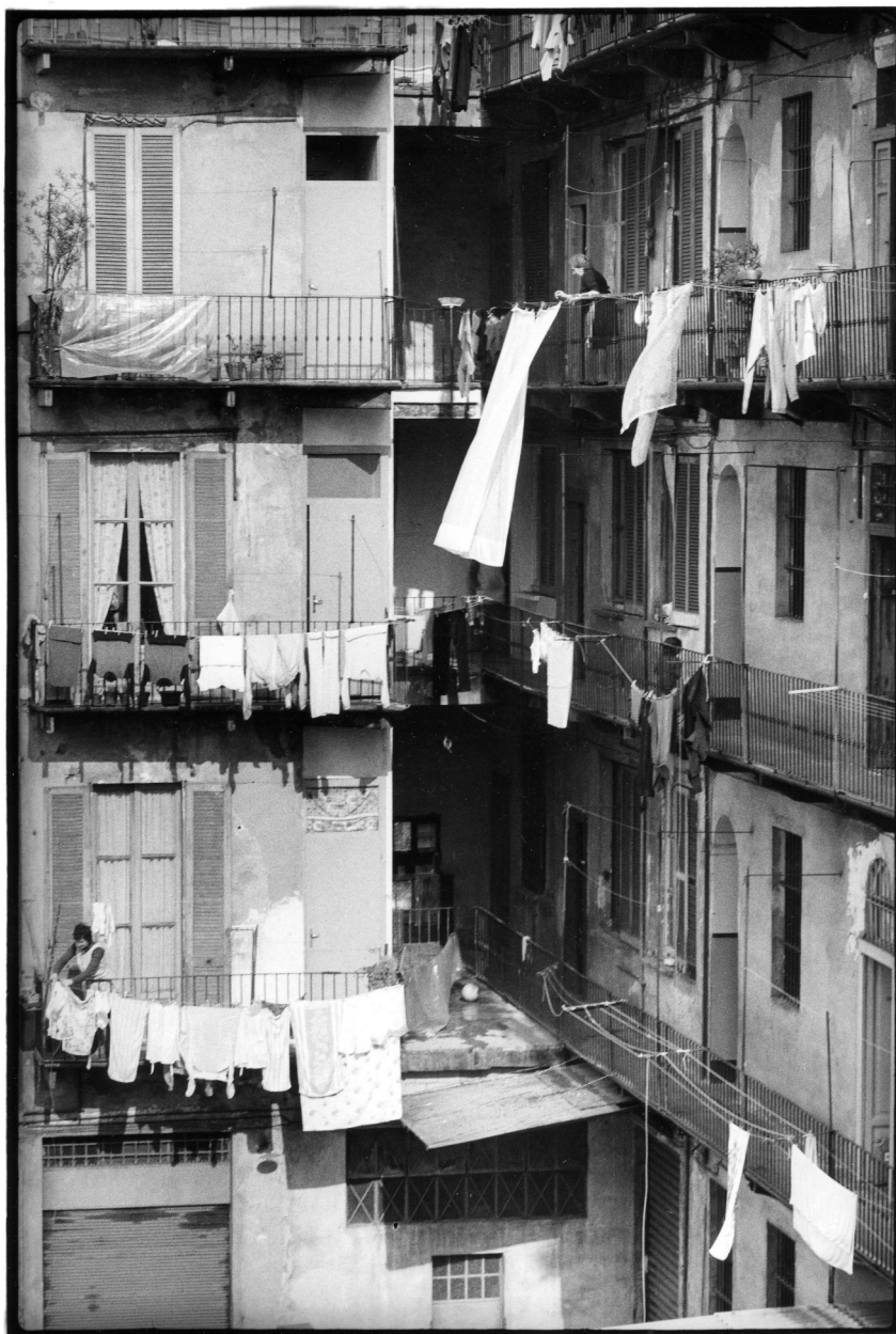
11 Paola Mattioli, senza titolo , 1975, stampa fotografica in bianco e nero, 40 x 30 cm. Archivio Paola Mattioli, Milano.