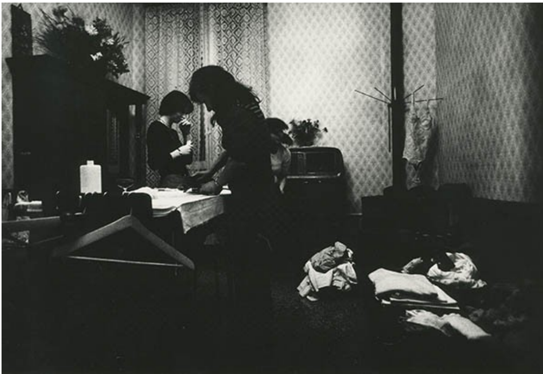
5 Carla Cerati, senza titolo , 1975, stampa fotografica in bianco e nero, 30 x 40 cm. CSAC, Università di Parma.