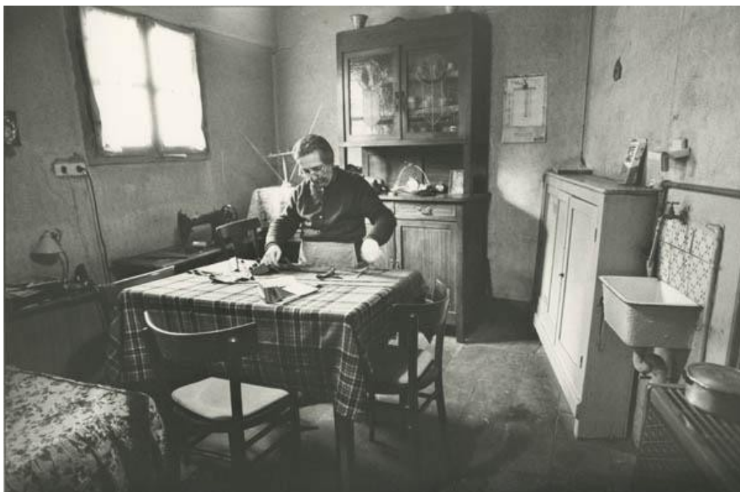
2 Giovanna Nuvoletti, senza titolo , 1975, stampa fotografica in bianco e nero, 30 x 40 cm. CSAC, Università di Parma.