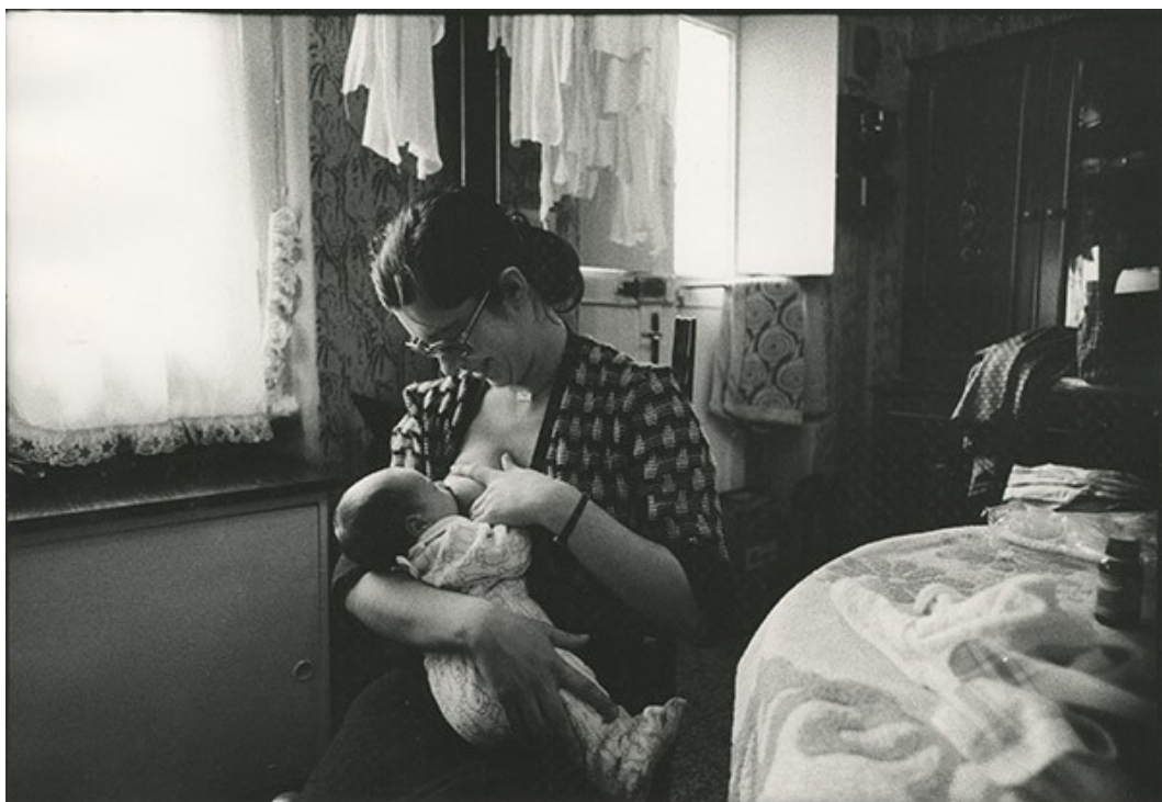
4 Carla Cerati, senza titolo , 1975, stampa fotografica in bianco e nero, 30 x 40 cm. CSAC, Università di Parma.