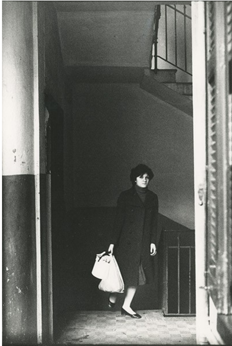
1 Carla Cerati, senza titolo , 1975, stampa fotografica in bianco e nero, 40 x 30 cm. CSAC, Università di Parma.