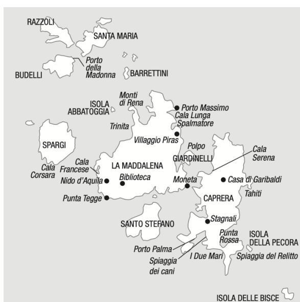
La carta-mappa dell'Arcipelago della Maddalena in Isolatria . 10

In Isolatria. Viaggio nell'arcipelago della Maddalena , troviamo un'immagine dell'arcipelago omonimo, che assume uno statuto duplice: è una carta, cioè una rappresentazione oggettiva del territorio, ma è anche una mappa, perché vi sono segnalati dei luoghi (per esempio: la Biblioteca ) che sono parte integrante del percorso descritto dall'autrice, dando una connotazione di movimento – come a segnare un itinerario – e di spazio privato alle isole, con la segnalazione non di tutti i luoghi presenti, ma di quelli attraversati e vissuti dall'io.