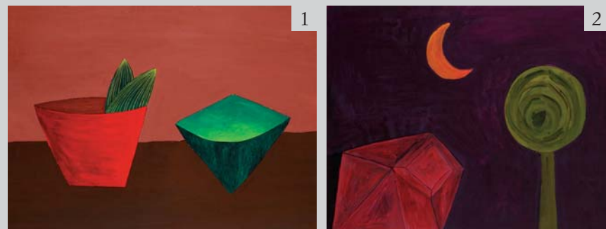
Figures 1, 2 Lucio Saffaro, Senza titolo , 1950s; tempera on paper. © Coll. Saffaro Foundation, Bologna.

The Italian text was published in Lucio Saffaro. Opere grafiche 1952-1991 . Bologna: Edizioni Aspasia, pp. 120; catalogue of the exhibition at the Brera Academy of Arts (Milan, May 6 - June 30, 2009).