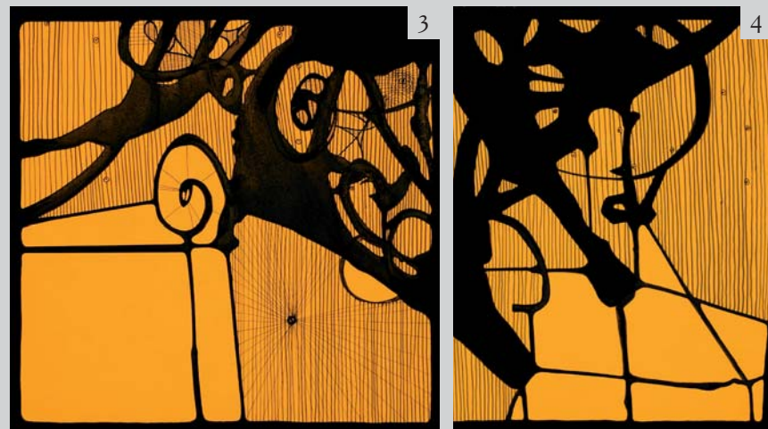
Figure 3 Lucio Saffaro, Studio per i livelli superiori del palazzo di Cnosso , 1965; black Indian ink on yellow cardboard, 27,4x26,8 cm.

The graphic work of Saffaro is therefore the place of his intellectual and then artistic experience. Intellectual experience because, when elaborating an idea into a shape, historical and mathematical, aesthetic and literary skills are needed and interact, on multiple levels of knowledge and meaning. This also happens in literary works and is not always easy to interpret. I hope the [three N.d.R.] unpublished texts in this publication, can help to understand more fully the personality of the artist, who – almost always – is known and appreciated separately, by different enthusiasts in the various fields of knowledge in which he worked. In Saffaro, however, the internal connections were rooted: mathematics can hide behind words as in figures, we find these in his poetic prose and here are described as configurations that appear in drawings and in painting. These are often enigmatic links, certainly made more intense by a personality that has privileged introspection, deep reflection on his most natural experiences, drawing on those ideas on which he has written and obtained images that seem to turn thought into shape.