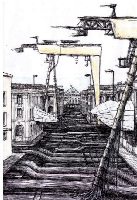
Cranes. Ink and watercolor on paper 33x48 cm, 2013. © Michela De Domenico.

La clessidra è uno strumento che rappresenta e misura il tempo finito. Per prolungare la sua azione verso un ipotetico tempo infinito si rende necessaria la volontà dell'uomo, che deve intervenire a cadenze regolari per proseguire la misurazione. La possibilità e la capacità di prolungare la misurazione per un successivo ciclo dà l'illusione di poter governare infinitamente il tempo, ma in realtà ne allunga semplicemente la durata per un ulteriore tempo aggiuntivo, sempre limitato.