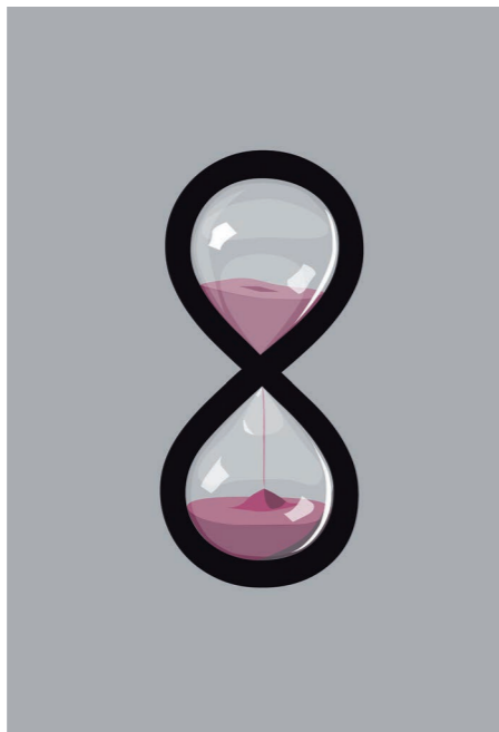
In-finite time. Digital drawing, 2019. © Enrico Cicalò.

How long does an image last? Often the images outlive what they denote and so they preserve and transmit its memory for a long time. Sometimes it is their physical equipment that lasts longer. In fact carved and engraved images, or otherwise recorded in long-lived artifacts, often embedded in them, can acquire over time greater value than the messages themselves. Even the duplicates that can be obtained by copy, by imprint or otherwise executed, can assume an independent value and have their own story. Then the image bears witness to the civilization that produces it, but also to the one that safeguards it and uses it. Studying the image means studying the whole of humanity, therefore its conservation and duration are an objective of cultural interest. Its reproductions, prints or photographs, have always accompanied the progress of knowledge and are an irreplaceable document of human passing on the planet. Nowadays, even digitized, the images convey the history of mankind events, the evolution of culture and the mutations of architecture in an incomparable way. They help human being to become fully aware of the change in what Ervin Schroeder calls "the image of the world", since they make it very clear where he lives, in what era and how. The image durability is therefore a guarantee of human self-awareness.