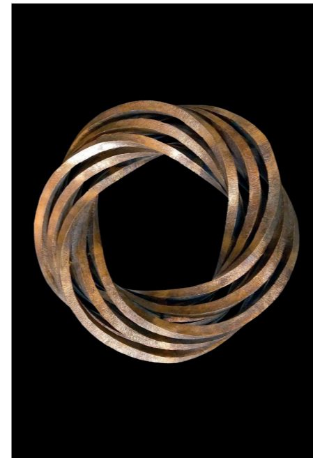
Furor Mathematicus. Lost wax bronze sculpture, 65x65x20 cm, 2018. © Ruggero Lenci.

Il disegno contamina le forme dell'esistente con quelle della fantasia, individuando i punti di forza inespresi dei luoghi della città, sovrapponendo nuovi segni e nuove strutture a quelle esistenti. In tal modo, forme tecnologiche in metamorfosi attraversano le pareti degli edifici del centro storico di Messina, quali elementi che si auto-rigenerano sottoposti alle leggi di crescita assiale dei cristalli. Al di sotto della strada, grovigli di cavi e di tubi richiamano l'apparato digerente di un organismo vivente artificiale.