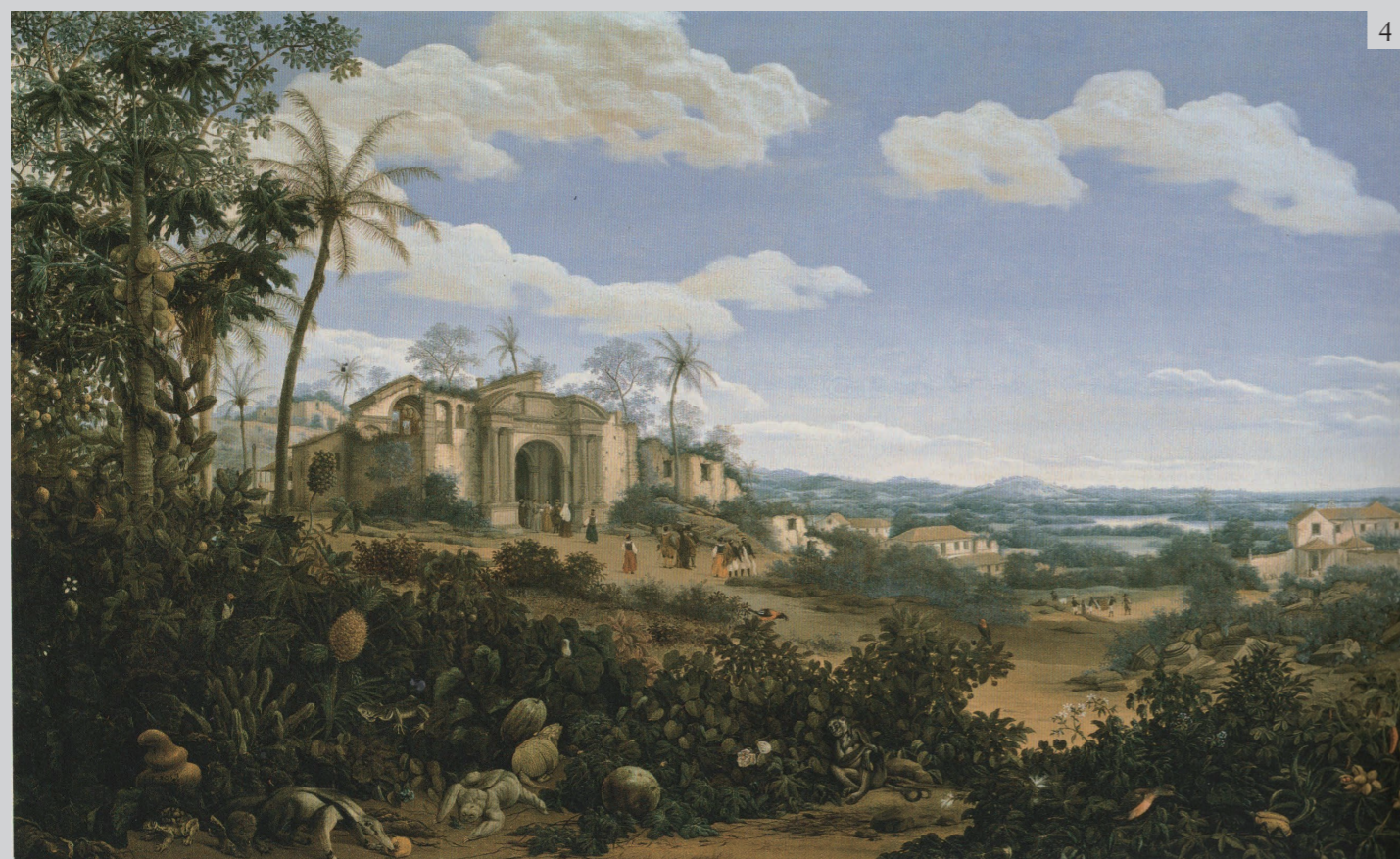
Figure 6 Frans Post, Landscape with European figures , s.d. Oil on panel. CORRÊA DO LAGO 2007, p. 270.

piante e animali derivante dal genere still life , dall'altra (Oliver 2013, p. 216; figg. 4-5).