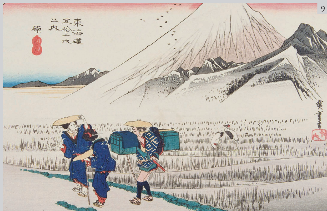
Figure 9 Utagawa Hiroshige, Mt. Fuji in the Morning , 1833–34. Woodblock print.

This would continue for a very long time. For example, Rutherford Alcock was among the