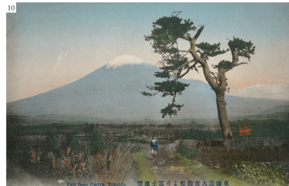
Figura 9 Utagawa Hiroshige, Il Monte Fuji al mattino , 1833–34. Xilografia. © Pubblico dominio.

E questo avverrà per un tempo molto lungo: quando, già superata la metà dell'Ottocento, Rutherford Alcock sarà tra i primi, in qualità di ambasciatore britannico, a raggiungere il Giappone da poco aperto all'Occidente, accompagnerà il racconto del suo soggiorno sul suolo nipponico ancora con un cospicuo numero di cromolitografie, decisamente pittoresche, per poter meglio descriverne luo-