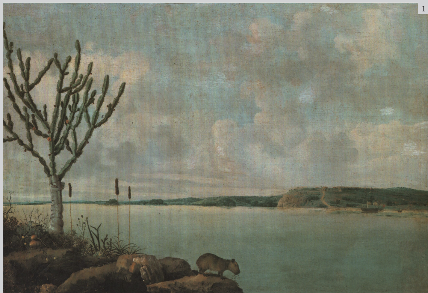
Figure 3 Frans Post, Fort Frederik Hendrik , 1640. Oil on canvas. CORRÊA DO LAGO 2007, p. 110.

lo stesso conte coltivava interessi scientifici ed era vicino a Constantin Huygens, noto per il suo contributo alla realizzazione del telescopio. Come accennato in precedenza, l'attenzione ai mondi dischiusi dai progressi dell'ottica, sia per quanto essa consentiva di scrutare in una dimensione molto vicina, come nel caso del microscopio, sia per lo studio del molto lontano, come per il cannocchiale, assumeva un ruolo centrale nei rapporti tra scienza e arte, tanto da far affermare allo stesso Huygens che il mondo improvvisamente apparso sotto l'ingrandimento delle lenti del microscopio fosse il vero "mondo nuovo" (Alpers 1984, p. 25). Gli artisti olandesi, in quel periodo, erano peraltro ben consapevoli della sfida portata ai fondamenti euclidei della prospettiva dalle nuove teorie della visione inaugurate da Keplero, in base alle quali si attivavano a sperimentare per i loro dipinti l'uso di lenti, della