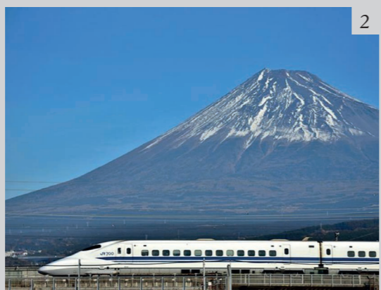
Figure 2 The shinkansen train with Mount Fuji in the background. [visited 27 January 2021]. Available at: https://real-world-research.jp/e0803259099/ .

itself, remains, even today, one of the pillars of the Cool Japan campaign, set up as early as 2002 by the Japanese government, and defined as a form of ‘soft power’, i.e. “the power of cultural or ideological meanings to indirectly influence behavior or interest”.