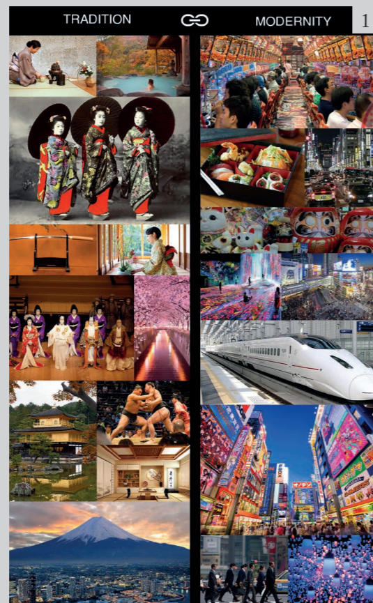
Figure 1 The comparison between tradition and modernity in Japanese culture.

The images that the Japanese offer are therefore unique, different from other countries, with a harmonious mix of tradition and modernity. On the one hand, the expression of a traditional society shows images of icons such as sumo wrestling, the kabuki theatre, ikebana , the katana , the tea ceremony, geishe