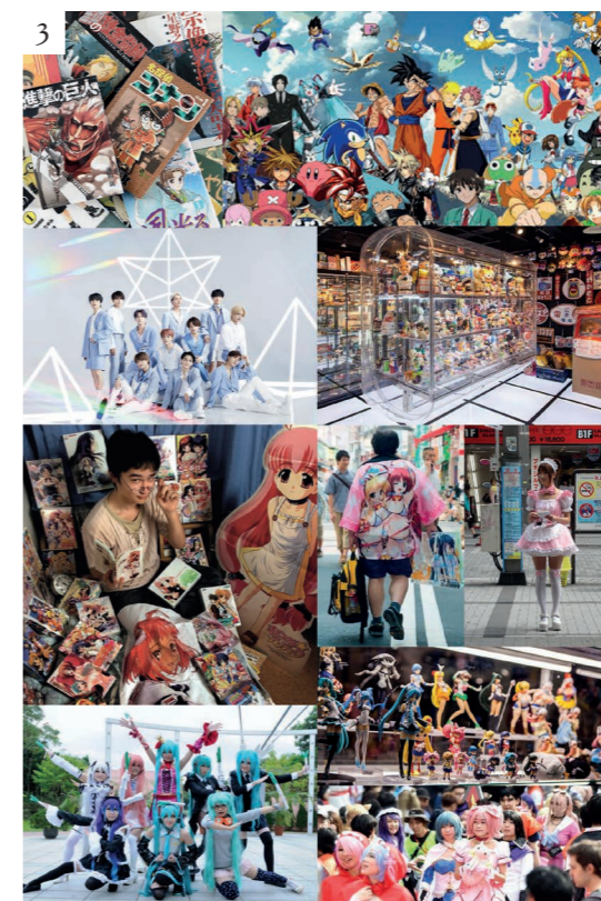
Figura 3 Immagini che rappresentano i fenomeni giapponesi di cosplay , j-pop , kabuki , otaku , meido , anime e manga . © Le autrici

nazione e ci permettono, appunto, di produrre immagini stereotipate. Ossia immagini che si creano a partire da conoscenze superficiali e che non devono indurre a conclusioni troppo affrettate su una cultura. In questo studio, infatti, l'obiettivo è quello di giungere a una comprensione più profonda di ciò che si cela dietro alle immagini che i giapponesi mostrano fuori confine. I giapponesi sono ben consapevoli che la rappresentazione e la formazione di immagini attraverso simboli e brand – e non soltanto stereotipi – influisce, a scala geografica, sul loro sviluppo turistico, culturale, creativo e sociale. Le immagini stereotipate sono durevoli, sono più durature di un'opinione o di un atteggiamento, sono adatte a veicolare un messaggio e pertanto sono difficili da modificare, motivo per il quale i mezzi di comunicazione di massa giocano un ruolo cruciale nella creazione di immagini stereotipate. Eppure, la globalizzazione ha risvegliato gli Stati a cercare le proprie differenze culturali e locali e a veicolarle tramite l'immagine. Il Giappone questo lo ha recepito bene, caricando le immagini di significato, di senso e di profondità. L'attrazione di turisti stra-