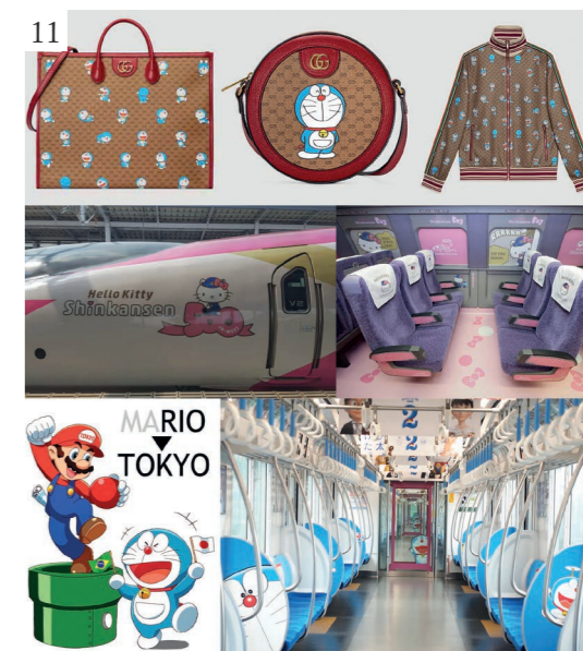
Figura 11 I personaggi più rappresentativi quali Hello Kitty e Doraemon come icone della cultura giapponese.

Questo contributo intende mettere in luce come le immagini diffuse in tutto il mondo come ambasciatrici culturali del nuovo Giappone, dai tratti grafici semplificati e dai significati apparentemente leggeri e frivoli, trovino le loro profonde radici nella cultura tradizionale kawaii , al centro della moderna società giapponese (fig. 11). Gli oggetti e i comportamenti kawaii , legati a un senso di dipendenza e alla necessità di prendersi cura degli altri e di essere curati, esemplificati dal termine amae , permettono la creazione di interconnessioni tra gli individui, mantenendo l'armonia e la pace nella società giapponese. Il Japan style , grazie a questa straordinaria campagna di immagine, germoglia attraverso le crepe degli standard globali, narrando nuovamente in modo unico la cultura e la storia del Giappone.