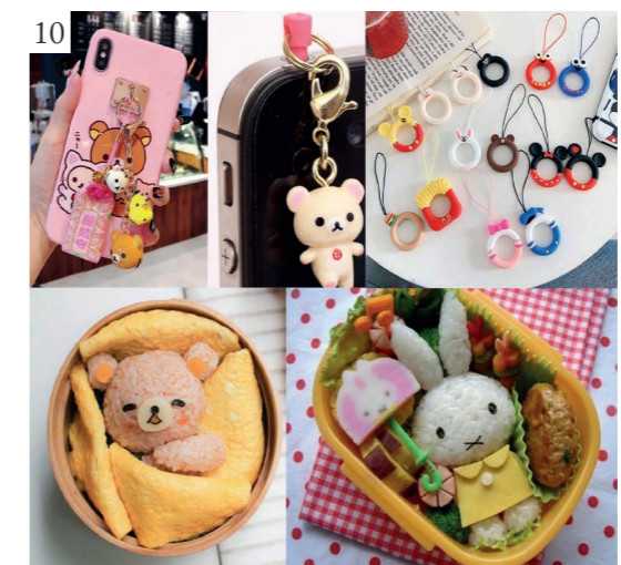
Figure 8 Il manga antico di Junko Shibata che illustra il testo del saggio intitolato Makura-(no)-Soushi dell'anno mille d.C. © Junko Shibata.