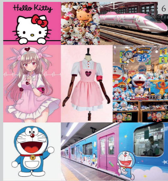
Figure 6 Illustrative images of kiwaa , with the most representative characters such as Hello Kitty, Lolita and Doraemon.

In general, kawaii is composed of two kanji meaning ‘able’ and ‘love’ respectively, which combined take on the meaning of lovable. The Japanese idea of cuteness, in fact, underlines the sense of pathos that the powerless and vulnerable object arouses in the mind of the observer. The emotion of sadness associated with beauty is familiar to those who have studied the classical aesthetics of Japan.