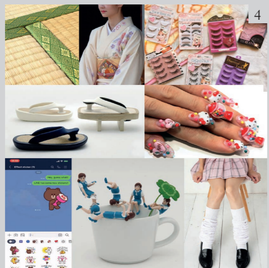
Figure 4 Images of modern Japan that recall the expressions of the kiwa concept.

In the images it is clear how Japan is able to manage cultural complexity without deflating it. And this concept has its roots in the kata . Only after having learnt and internalised this concept so that it is automatically included in every action, only then will it be possible to disrupt it, and it is there that the originality, the highest creativity of the images is born. A sort of cultural memory condensed and preserved as a form. It should be noted that in Japan there is no European distinction between the major arts (architecture, painting and sculpture) and the minor arts (everything else); on the contrary, the tendency has always been to blend media and techniques with the