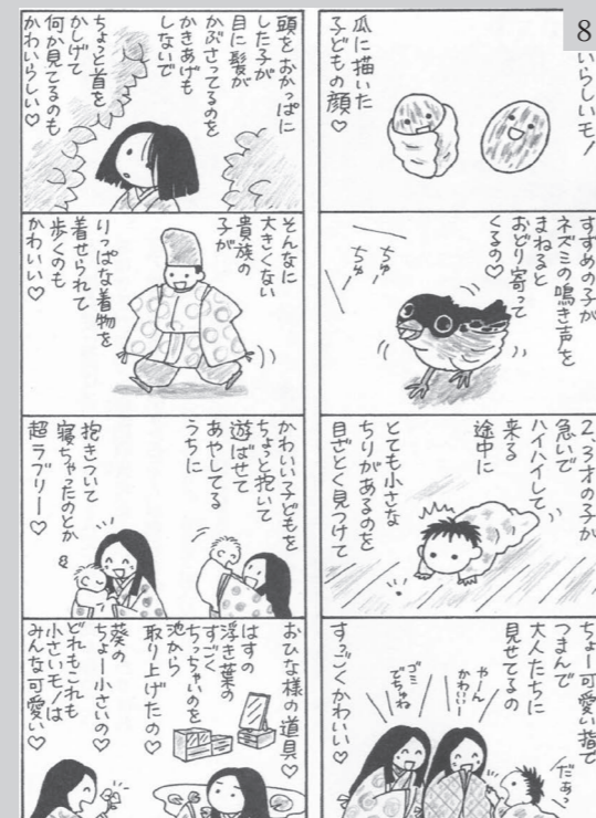
Figure 8 The ancient manga of Junko Shibata that illustrates the text of the essay entitled Makura-(no)-Soushi from the year 1000 AD. © Junko Shibata.

The undeniable universal appeal of kawaii culture, which has crossed cultural and geographical boundaries, is due to its delica-