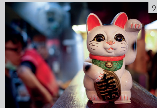
Figure 9 The lucky cat maneki-neko , symbol of prosperity.